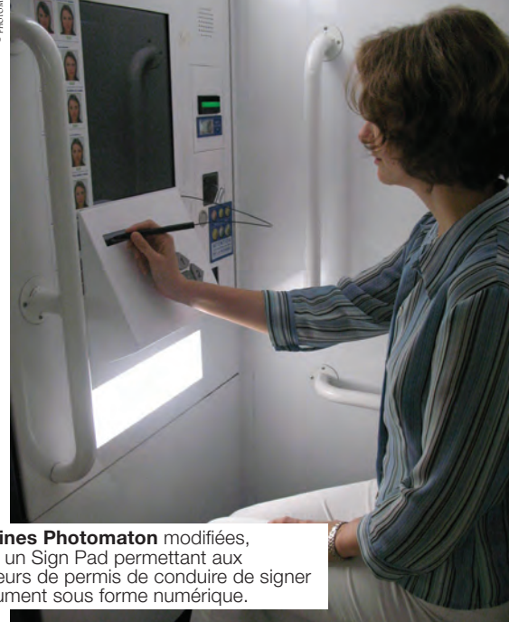
Les cabines Photomaton modifiées, intègrent un Sign Pad permettant aux demandeurs de permis de conduire de signer leur document sous forme numérique.

Exemple de signalétique mises en place dans les cabines photo. La signature pourra être réalisée sur écran tactile ou à l'aide d'un Sign Pad disposé sous l'écran.