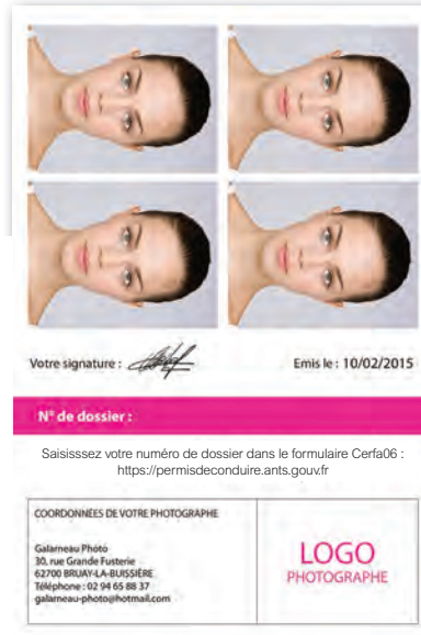
1. Prise de vue classique - 2. Ajustement - 3. Sélection standard - 4. Signature sur Sign Pad (ou écran tactile) - 5. Envoi au collecteur du GIE.

avec les informations associées. Le QR code et la notice d'information ne sont pas obligatoires. La norme de qualité photographique reste inchangée (format 45 x 35 mm, jpeg2000 en 300 dpi). La signature acquise par un dispositif tactile lors de la prise de vue doit répondre aux exigences d'une résolution de 300 dpi soit 134 x 521 px.